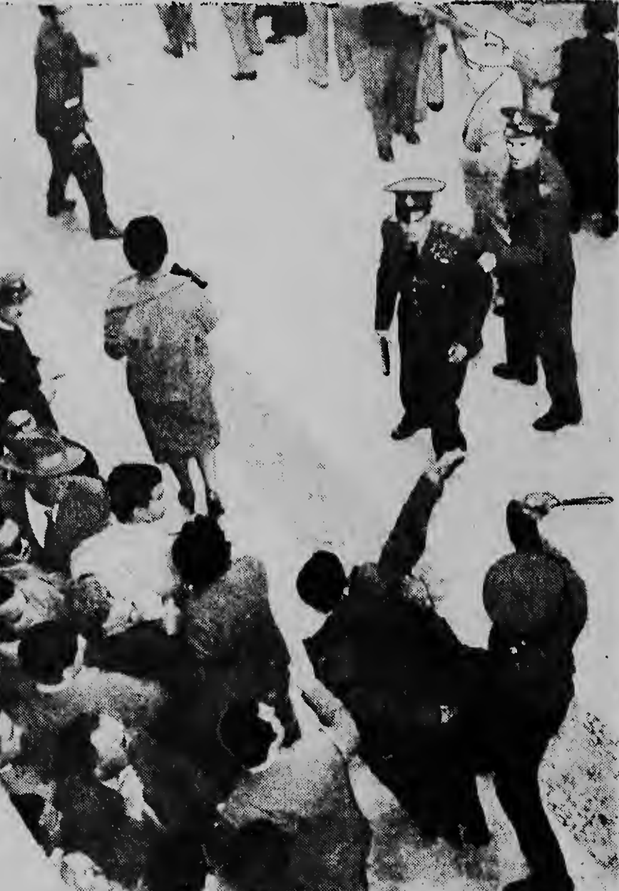
Terwijl twee Atheense agenten toekijken gaat een derde een demonstrant te lijf met een gummistok. Dit is een beeld tijdens een demonstratie tegen de Engelsen.